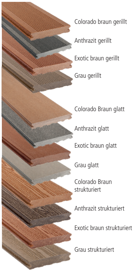
Farben können variieren.